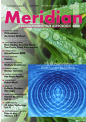
Rezension in Meridian 1-2008